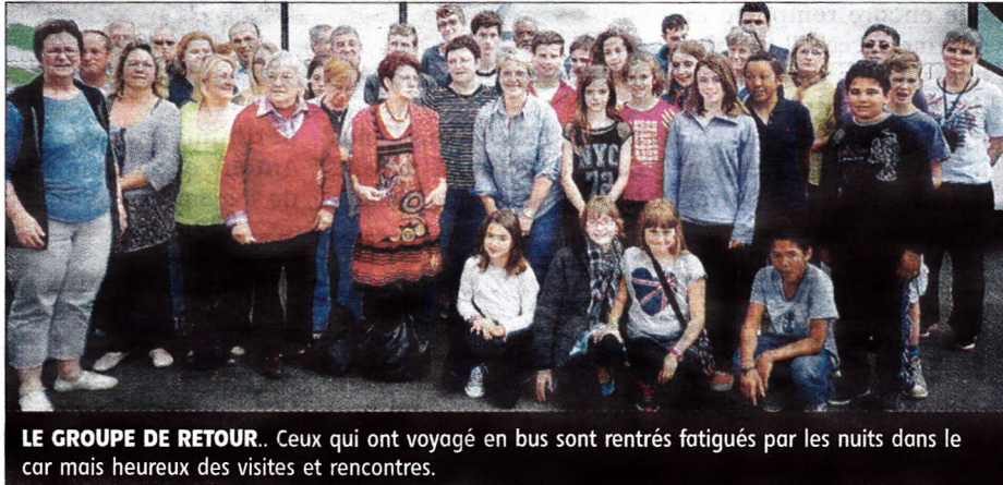
LE GROUPE DE RETOUR. Ceux qui ont voyagé en bus sont rentrés fatigués par les nuits dans le car mais heureux des visites et rencontres.

Les autres sorties ont entre autres mené les visiteurs vers une chocolaterie dont le patron a réalisé le gâteau de mariage de Lady Di et du prince Charles et qui leur a mon-