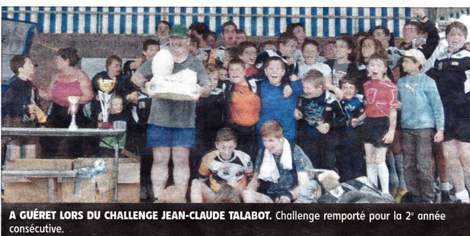
A GUÉRET LORS DU CHALLENGE JEAN-CLAUDE TALABOT. Challenge remporté pour la 2 e année consécutive.