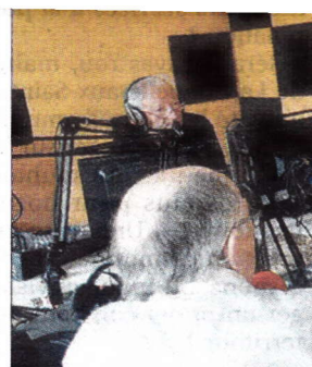
LUC LEBLANC. 20 ans après, heures de sa carrière.